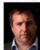
Irish Men's Sheds Association