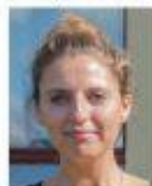
Forum For Mænds Sundhed