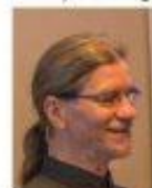
Federation University Australia