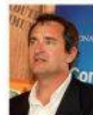
Australian Men's Shed Association